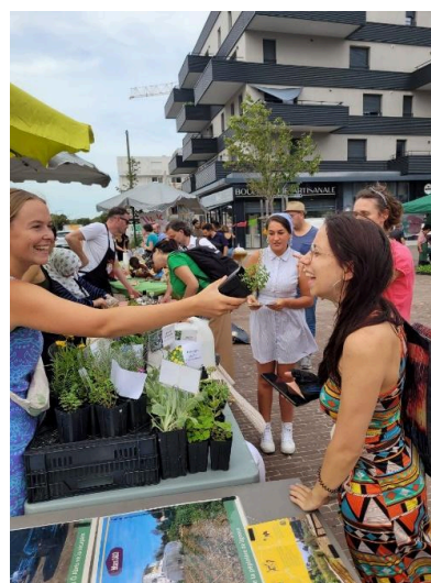
Ici ça bouge en Bio