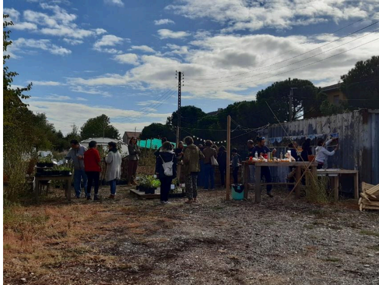
Vente d'automne à la pépinière