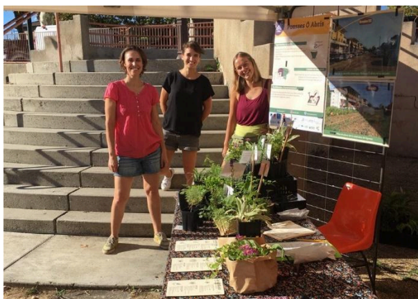
Vente sur le marché de Castelmaurou