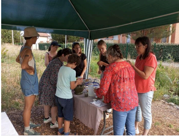
Atelier d'été sur la lactofermentation