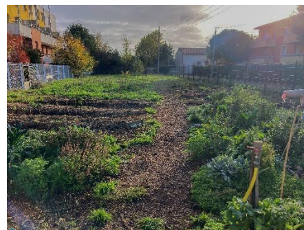
Nouvelles lignes potagères