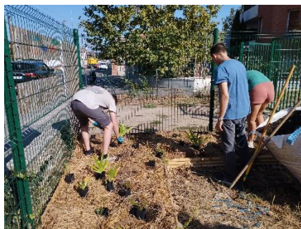
Plantation du devant de la parcelle

Enfin, nous avons planté de nombreux endroits au printemps et à l'automne. Un espace de plantation sur le devant de la parcelle a vu le jour début octobre, ainsi qu'une structure en saule des vanniers, que nous espérons voir pousser dans les années à venir. Nous avons planté le long du grillage ainsi que dans de nouveaux espaces créés tout au long de l'année derrière la serre. Enfin, comme l'automne est le moment idéal pour planter des arbres, nous avons décidé de créer une haie champêtre à l'arrière de la parcelle, en vue d'installer nos futures toilettes sèches non loin de là.