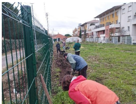
Plantation d'une haie