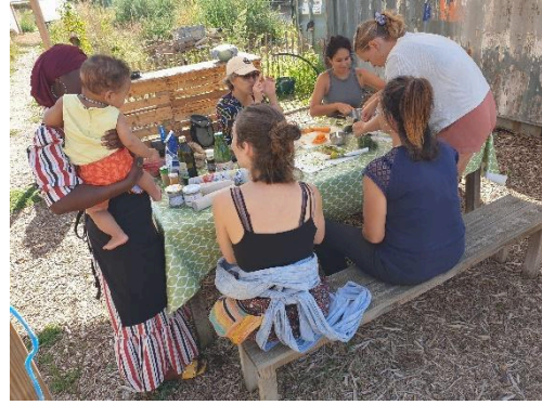
Atelier cuisine avec Cocagne Alimen'terre