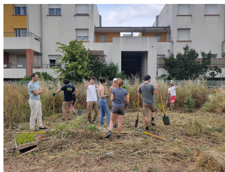
Plantation d'une forêt-jardin